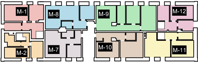
SCHEMAT LOKALIZACJI MIESZKAŃ